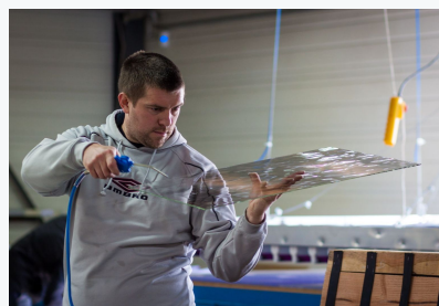
Yoan Werkplaatschef, meer dan 15 jaar ervaring in het glasvak